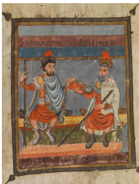
Boécio (à direita) e Símaco (à esquerda), seu sogro. De institutione arithmetica . Iluminura (c. 845), Msc. Class. 5, folio 2v. Staatsbibliothek Bamberg (public domain).