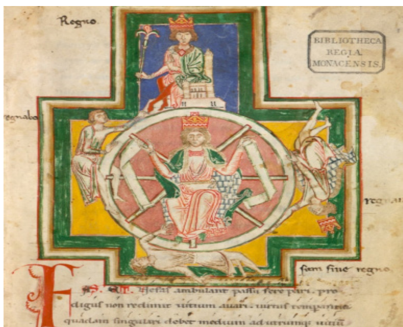
Carmina Burana (Codex Buranus). Bayerische Staatsbibliothek, Clm 4660, folio 1r. (public domain). «Na primeira página do manuscrito está a famosa imagem que lhe serve de assinatura, a Roda da Fortuna, representando um rei que a preside