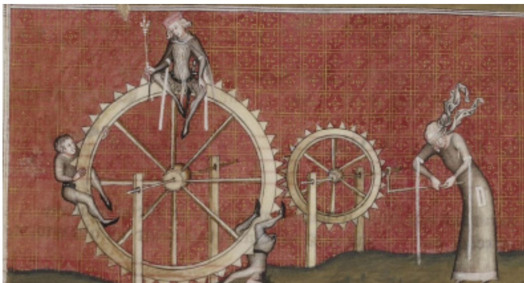
Guillaume de Machaut (c. 1300-1377). Poésies: Jugement du roi de Bohême (c. 1350-1355). Remède de Fortune (23-58v). Bibliothèque nationale de France. Département des Manuscrits, iluminura, detalhe do folio 30v. (public domain).